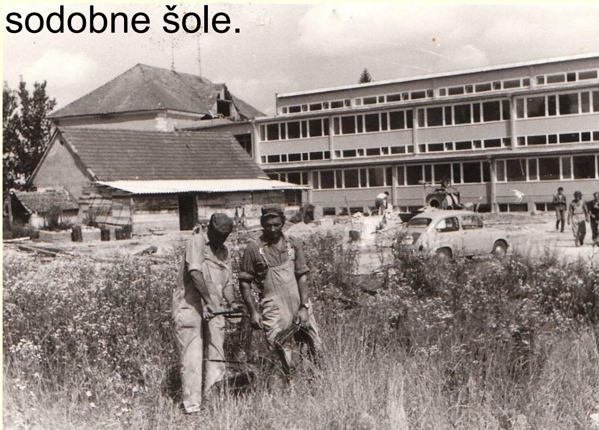
gradnja nove šole