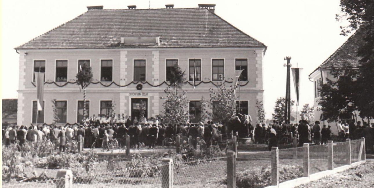
200 let šole