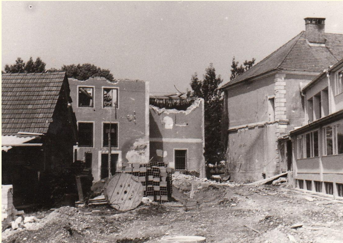
gradnja nove šole