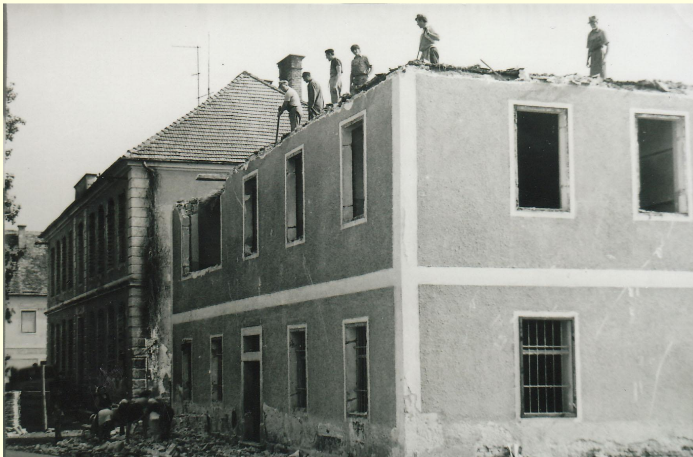
rušenje prve šole