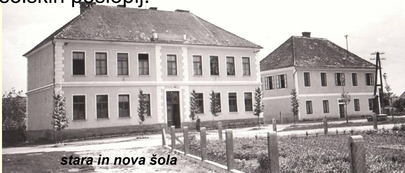
stara in nova šola