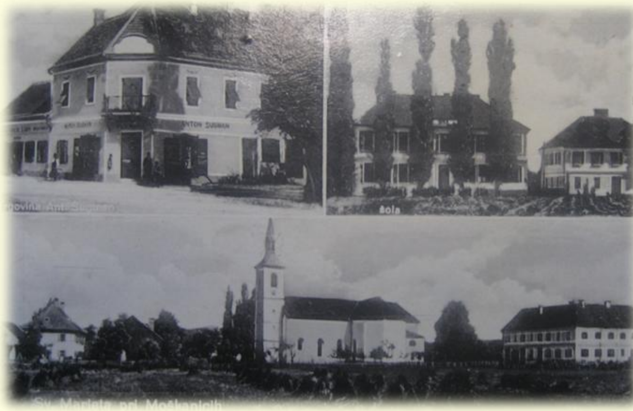
Sveta Marija niže Ptuja z razglednice