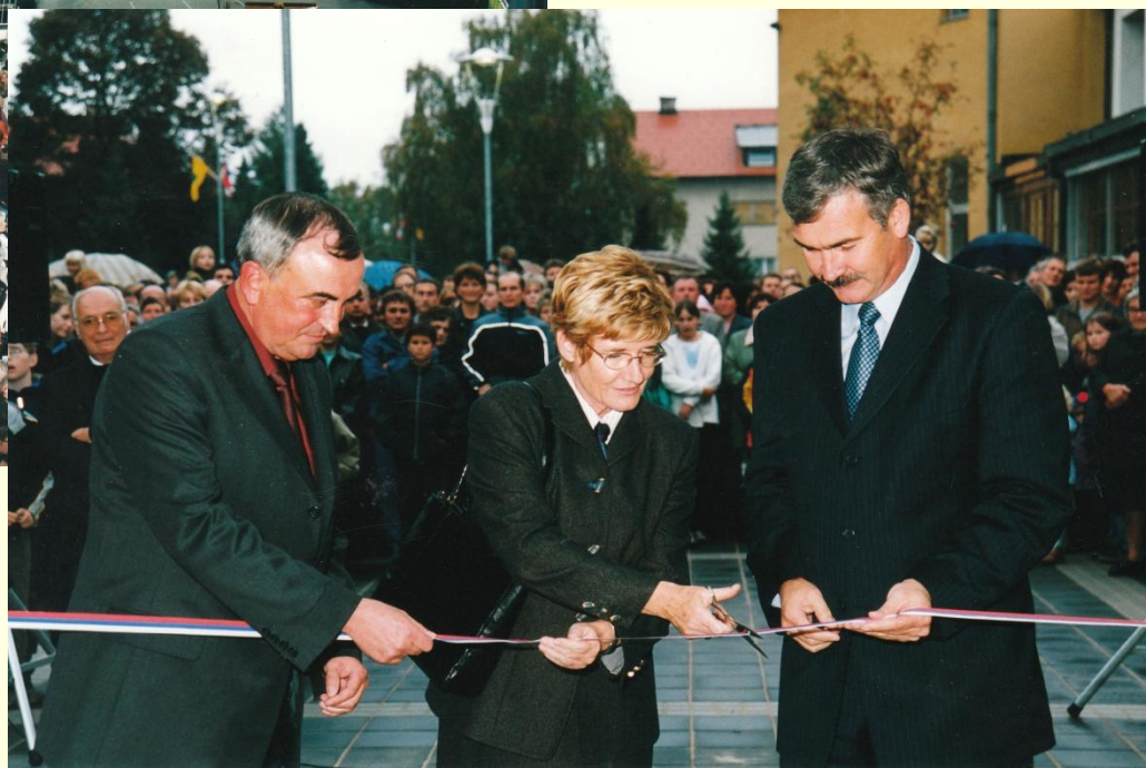
otvoritev današnje šole