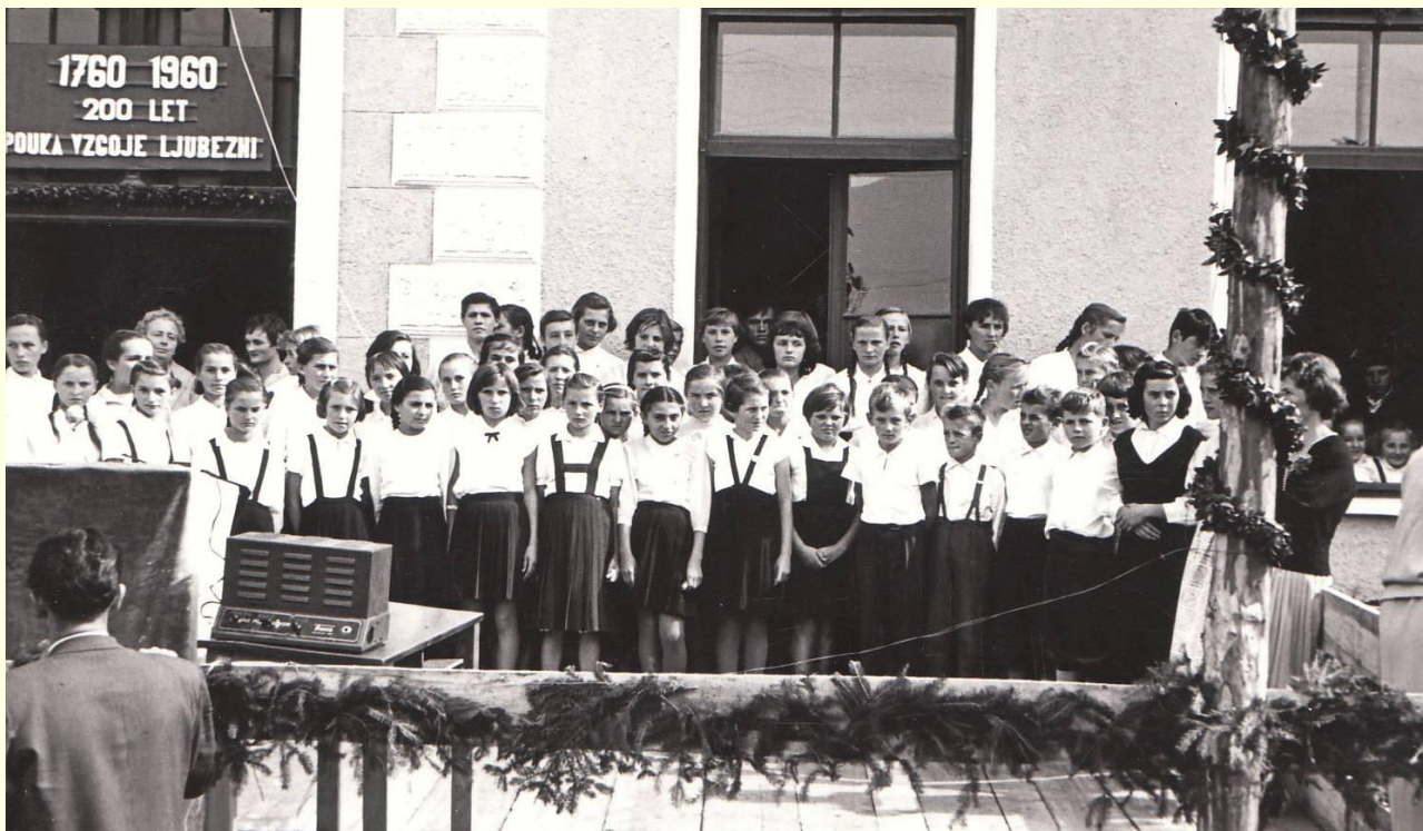
200 let šole