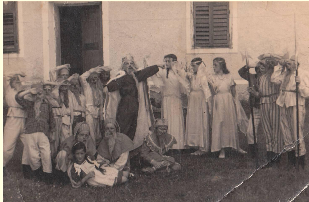
V kraljestvu palčkov, 1952